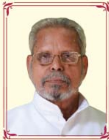
വന്ദ്യ വർക്കി ചുണ്ടേവാലേൽ അച്ചന്ത് തിരുവല്ല അതിഭദ്രോസനത്തിന്റെ ആദരാഞ്ജലികൾ