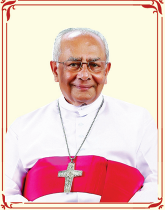
മാർ പോൾ ചിറ്റിലപ്പള്ളി