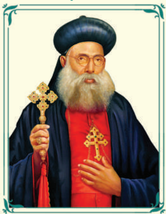
വൈദാനുസ് ആർച്ച് ബിഷപ്പ് മാർ ജോവാനിയോസ് വലിയ മെത്രാപ്പോലീത്ത